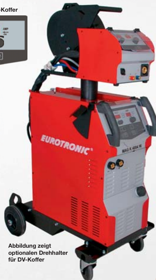
Abbildung zeigt optionalen Drehhalter für DV-Koffer

Funktionen: MIS Schweißen, Hyper Force Schweißen, MMA Elektroden Schweißen, WIG Lift Arc